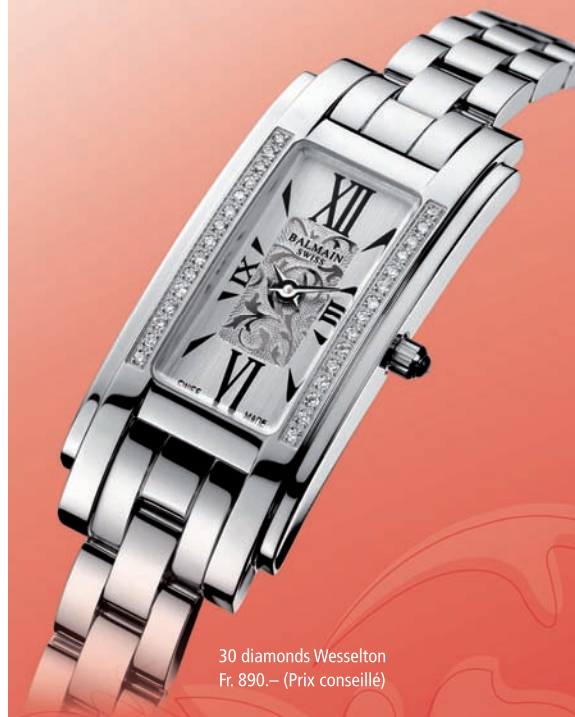
30 diamants Wesselton Fr. 890.- (Prix conseillé)