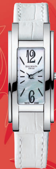
Fr. 350.- (Prix conseillé)