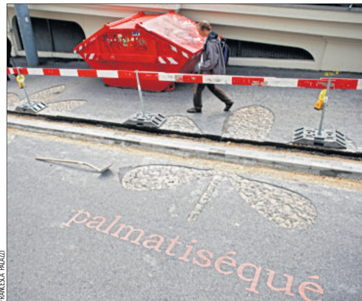
L'installation intitulée Palmatifide faisait partie des trois créations de Lausanne Jardins 2004 à avoir été conservées après l'événement.