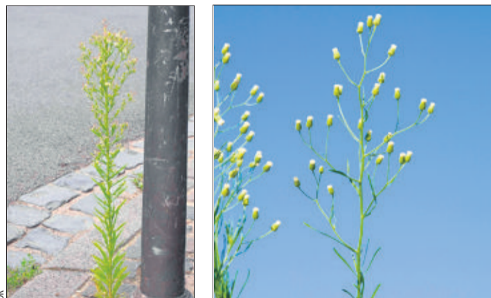
La vergerette du Canada (à dr.) est très répandue en Suisse. Sa très résistante cousine de Buenos Aires (à g.) - avec ses fleurs plus grosses et moins nombreuses - vient d'être recensée en Lavaux.

La vergerette de Buenos Aires développe en ce moment même ses petites fleurs blanches. Elle ressemble beaucoup à sa cousine du Canada, implantée un peu partout en Suisse. Les deux se distinguent